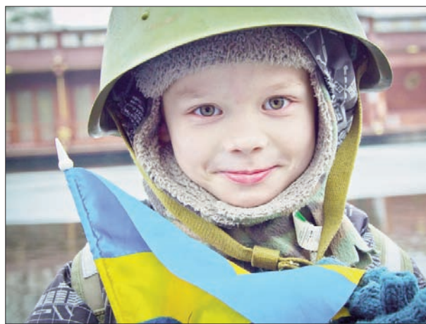
Українське військо, мов з могили встало, Загриміло в бубни, в сурмоньки заграло, Розгорнуло прапор соняшно-блакитний, Прапор України! Рідний, заповітний!